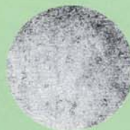
B テープ表面の扁平状黒鉛層の状態。 黒鉛層が照明により白く光って見える。×90