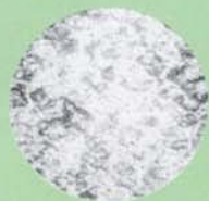
A ナイロン中に浮遊状態で介在する黒鉛粒子。 ×90